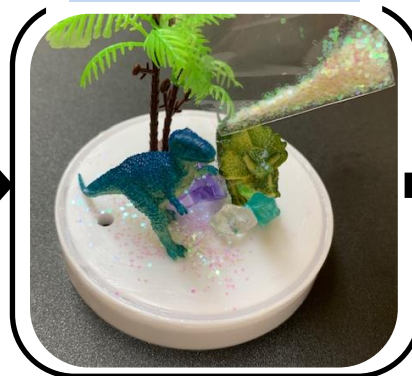
土台にパウダーを置く