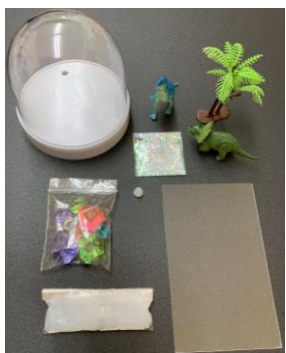
内容物を確認する