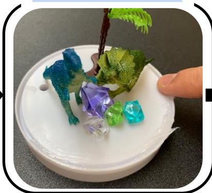
溝にシリコンを塗りこむ