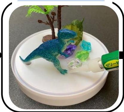
土台に中身を接着